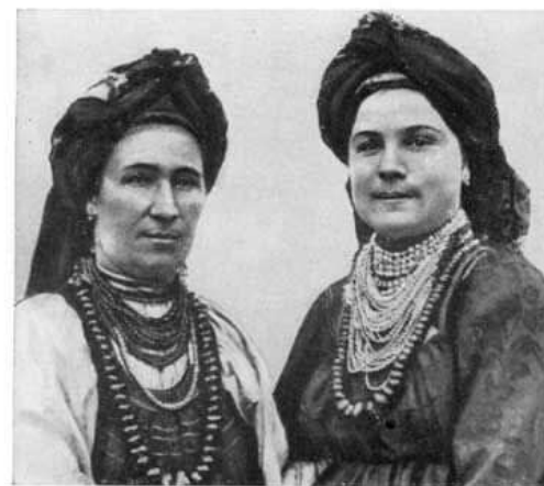
Западные бачуранки (1920 г. г. Читинский музей).

В середине XVIII века за Байкал были переселены из Польши и западных губерний старообрядцы («семейские»).