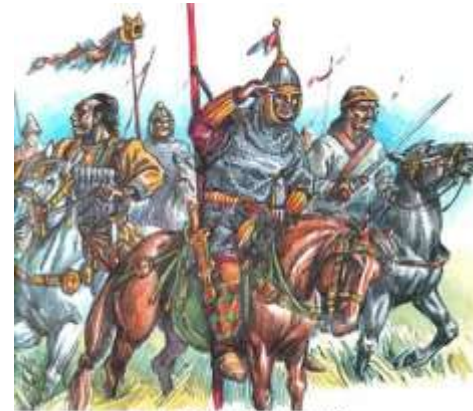
М. Горалик. "Поток гунов"

Одна из интереснейших культур в истории Бурятии связана с хунну . Гуннская держава просуществовала 300 лет. На северных рубежах своих владений хунну построили форпост – Нижне-Иволгинское городище. На юге Бурятии известно большое число хуннских захоронений, наиболее известное из них найдено в районе Усть-Кяхты, в Ильмовой пади.